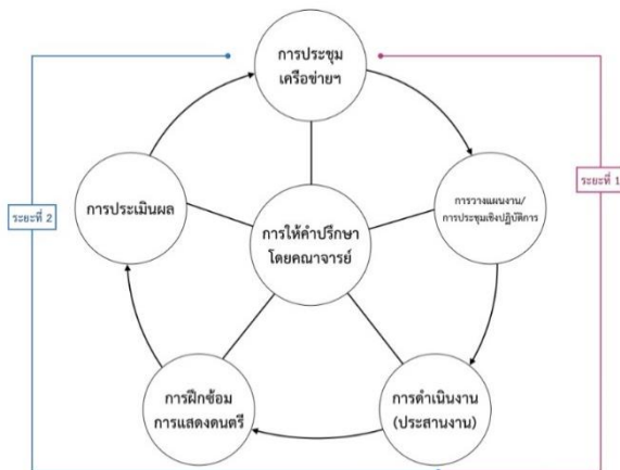
ภาพที่ 2 ทฤษฎีและแนวคิดในการดำเนินงานการแสดงคอนเสิร์ตเครือข่ายนิสิตนักศึกษา

การประชุมของเครือข่ายนิสิตนักศึกษาในระยะที่ 1 ได้มีการประชุมเพื่อแบ่งหน้าที่ตามความถนัด ความสนใจ โดยการดำเนินงานได้ทำตามแผนการดำเนินงานที่ตั้งไว้ ทั้งนี้ได้มีการปรับเปลี่ยนและยืดหยุ่นตามความเหมาะสมเพื่อความสะดวกในการดำเนินกิจกรรม ระบบการดำเนินงานกิจกรรมสัปดาห์คอนเสิร์ตเป็นไปตามวงจรคุณภาพ ซึ่งประกอบไปด้วยการวางแผนที่มีประสิทธิภาพและเหมาะสมกับเวลา การปฏิบัติตามแผน การตรวจสอบการปฏิบัติตามแผนและการดำเนินกิจกรรมให้เหมาะสม ตามทฤษฎีและแนวคิดที่ได้วางไว้สำหรับการดำเนินการ ดังภาพที่ 2 ทฤษฎีและแนวคิดในการดำเนินงานการแสดงคอนเสิร์ตเครือข่ายนิสิตนักศึกษา สามารถแบ่งออกเป็น 2 ระยะ (ศุภพร สุวรรณภักดี, 2562) ดังต่อไปนี้