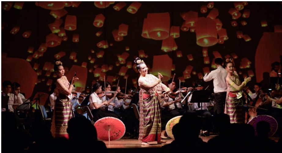
ภาพที่ 3 บรรยากาศสุขห้วคคอนเสิร์ตของเครือข่ายนิสิตนักศึกษา การแสดงชุดล่องแม่ปิง

รายการแสดงนำเสนอควบคู่ไปกับทัศนศิลป์ดิจิทัลเพื่อสร้างอารมณ์และความประทับใจกับผู้ชมโดยมีการศึกษาข้อมูลเพิ่มเติมของแต่ละบทประพันธ์ แล้วนำไปประยุกต์ใช้นำเสนอพร้อมกันกับการแสดงดนตรีของเครือข่ายนิสิตนักศึกษา ดังภาพที่ 3 (บันทึกการแสดงคอนเสิร์ตสามารถรับชมผ่านสื่อออนไลน์ได้ที่ Youtube: สุขห้วค อ น เ ลี ร ์ ต : https://www.youtube.com/watch?v=NZMJE2 kLHxk&t=3 2 s ) (PGVIM Channel, 2562)