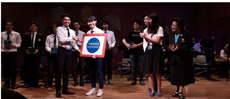
ภาพที่ 4 มรภ.บ้านสมเด็จเจ้าพระยา รับเป็นประธานจัดงานกิจกรรม THEMSN ปีที่ 2

เกิดความร่วมมือทั้งทางด้านการบริหารจัดการตามหน้าที่ที่ได้รับมอบหมาย ตลอดจน การแสดงดนตรี และการผสมผสานองค์ความรู้ทางด้านดนตรีและศิลปะแขนงอื่น ๆ เห็นได้จากการเรียบเรียงเสียงประสานของดนตรีพื้นบ้านขึ้นใหม่สำหรับการแสดง ร่วมกันระหว่างสถาบันอุดมศึกษา การผสมผสานนาฏศิลป์ไทยและการใช้วิถีทัศน์ ประกอบการแสดง การดำเนินงานในโอกาสของการจัดเครือข่ายนิสิตนักศึกษาฯ เพื่อให้เกิดความต่อเนื่องและสร้างความยั่งยืน โดยได้ส่งต่อการเป็นประธานจัดงานใน การจัดการประชุมและกิจกรรมของเครือข่ายนิสิตนักศึกษา โดยในปีที่ 2 วิทยาลัย การดนตรี มหาวิทยาลัยราชภัฏบ้านสมเด็จเจ้าพระยา รับเป็นประธานจัดงาน ดังภาพที่ 2