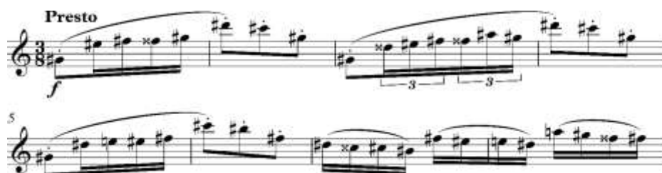
ภาพที่ 11 รูปแบบสำเนียงที่เป็นพื้นฐานของการสร้างจังหวะวอลซ์

การเล่นแบบมีสำเนียงจะต้องเล่นโดยมีการสนับสนุนลมจากปอดและกระบังลมตลอดเวลา เพื่อให้ได้เสียงที่มีน้ำหนัก และไม่สิ้นจนเกินไป ควบคุมโดยใช้ลิ้นแตะที่ลิ้นแข็งโซโฟนเพื่อเป็นการหยุดเสียง และให้เสียงยังคงลอยอยู่ในอากาศ