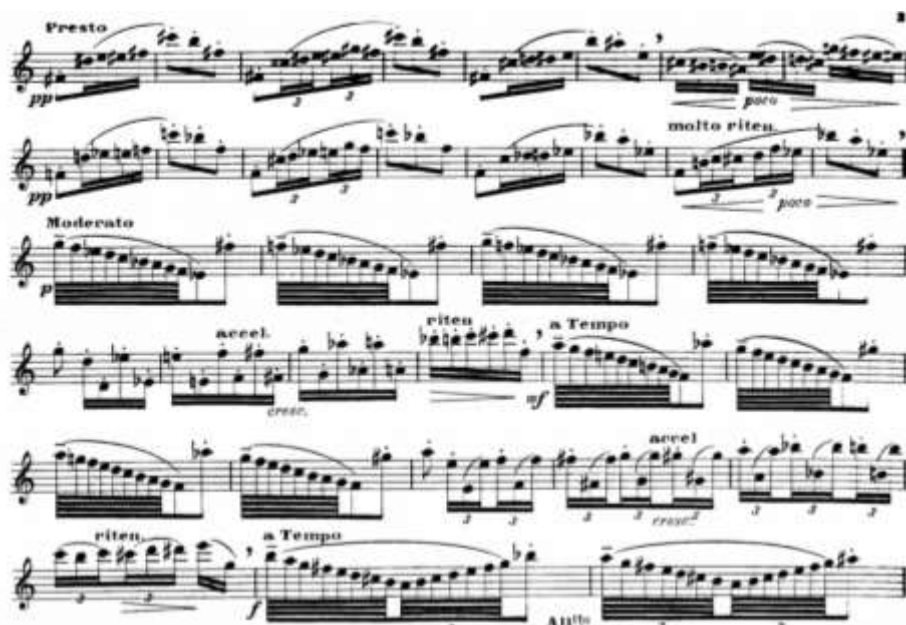
ภาพที่ 6 ลักษณะของทำนองและเสียงประสานที่ย้ายบันไดเสียงจากตอนนำเสนองานอง ห้องที่ 107-139

ภาพที่ 5 แสดงบทเพลงในท้องที่ 93-96 การดำเนินคอร์ดจะยึดอยู่บนพื้นฐานของ ii-V-I ภายใน 1 ห้อง หรือภายในประโยคเพลง ด้วยการใช้ทางเดินคอร์ดลักษณะนี้จะให้ความรู้สึกพุ่งไปข้างหน้าเพื่อจะส่งเข้าสู่ตอนที่ 3 ตอนย้อนทำนองหลัก