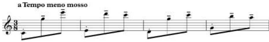
ภาพที่ 13 โน้ตหลักของท่อนพัฒนาทำนอง

หลังจากนั้นจึงเพิ่มโน้ตระดับเข้าไปโดยใช้เสียงโน้ตที่ส่งเข้าไปหาโน้ตหลัก และต้องคำนึงถึงค่าของโน้ตหลักที่จะต้องยาวใกล้เคียงกับตอนที่ไม่มีโน้ตระดับ