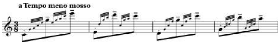
ภาพที่ 14 โน้ตหลักที่มีการเสริมโน้ตระดับ

หลังจากนั้นจึงเพิ่มโน้ตระดับเข้าไปโดยใช้เสียงโน้ตที่ส่งเข้าไปหาโน้ตหลัก และต้องคำนึงถึงค่าของโน้ตหลักที่จะต้องยาวใกล้เคียงกับตอนที่ไม่มีโน้ตระดับ