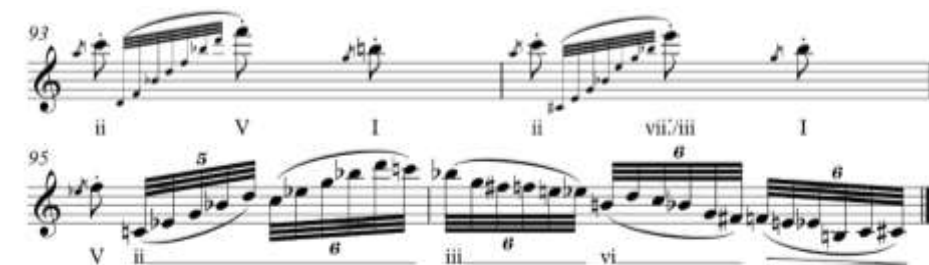
ภาพที่ 5 แสดงการดำเนินคอร์ดช่วงท้ายก่อนเข้าสู่ช่วงย้อนทำนองหลัก ห้องที่ 93-96

ห้องที่ 83-89 เป็นตอนพัฒนาทำนองของบทประพันธ์ เริ่มจากการเปลี่ยนบันไดเสียงมาอยู่ที่บันไดเสียง Bb Major Pentatonic ในห้องที่ 83-84 บันไดเสียง Eb Major Pentatonic ในห้องที่ 85-86 และดำเนินทำนองในลักษณะขึ้นและลง คล้ายลักษณะของลูกตุ้ม ซึ่งเป็นการดำเนินทำนองที่ทำให้ผู้ฟังรู้สึกถึงการร่ายรำ ย่ำเท้าวนไป วนมา แต่ก็พัฒนาทำนองด้วยการเปลี่ยนจากการเล่นโน้ตสั้น ๆ เป็นการไล่นोटต่อเนื่อง