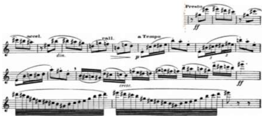
ภาพที่ 7 การเริ่มย่อนทำนองหลักโดยการกลับสู่บันไดเสียง C# Major ห้องที่ 159-180

โครงสร้างการดำเนินคอร์ดของบทประพันธ์ ภาพรวมของการดำเนินคอร์ดเป็นไปในรูปแบบของเพลงพื้นบ้านวอลซ์ ที่จะเริ่มด้วยคอร์ดหลัก ดำเนินไปหาคอร์ดที่สร้างความรู้สึกเอนเอียง จำพวกคอร์ดดิมินิช (Diminished Chord) และวนกลับมาสู่คอร์ดหลัก วนไปเช่นนี้โดยอาจจะมีการเปลี่ยนแปลงบันไดเสียงบ้างระหว่างท่อน และมีการใช้เทคนิคโน้ตเพดเดิล เพื่อให้รู้สึกถึงการยกเท้า ย่ำเท้าในการเต้นรำ เปลี่ยนแปลงบางตัวโน้ตเพื่อให้เสียงประสานที่เกิดขึ้นเปลี่ยนแปลงไปจนเกิดการดำเนินคอร์ดขึ้นได้