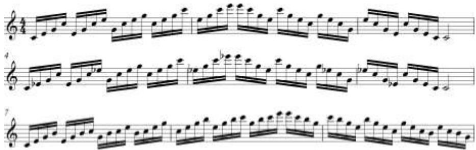
ภาพที่ 9 แบบฝึกหัดเพื่อฝึกฝนการเล่นโน้ตกระจายคอร์ด 1

กรณีการเล่นโน้ตที่กระโดดไปกระโดดมานั้น แบบฝึกหัดที่จะใช้เพื่อแก้ปัญหาาก็จะเป็นแบบฝึกหัดแบบกระจายคอร์ด (Arpeggio)