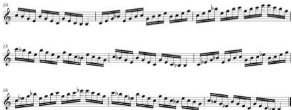
ภาพที่ 10 แบบฝึกหัดเพื่อฝึกฝนการเล่นโน้ตกระจายคอร์ด 2