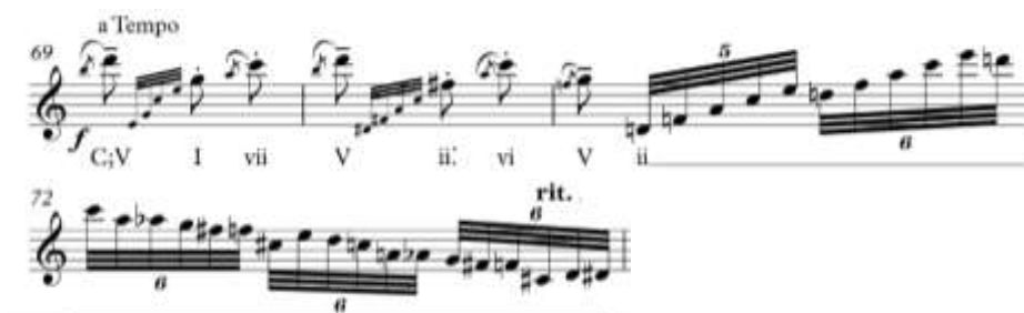
ภาพที่ 3 การดำเนินคอร์ดในช่วงที่ 3 ก่อนจะเข้าตอนพัฒนาทำนอง ห้องที่ 69-72

สำคัญมาอยู่ที่จังหวะที่ 3 โดยจะใช้โน้ตเพดเดิล เล่นค้างไว้เพื่อคงความรู้สึกของกลุ่มโน้ต และดำเนินทำนองด้วยเทคนิคการกระจายคอร์ด (Broken chord) เพื่อให้เกิดการดำเนินคอร์ด จากนั้นสรุปประโยคโดยการใช้เทคนิคโครมาติกเช่นเดิมแต่มีการเพิ่มโน้ตเคียงในรูปแบบกลุ่มโน้ตประดับ (Appoggiatura) เข้ามาเพื่อให้รู้สึกถึงการดำเนินทำนองเดินหน้าและถอยหลัง