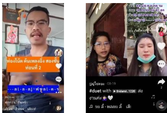
ภาพที่ 3 การใช้แอปพลิเคชัน TikTok

4. Network คือ ผู้สอน ต้องการให้ผู้เรียน รู้จริง ในการเชื่อมโยงองค์ความรู้ ทั้งนี้ผู้เขียนแบ่งออกเป็น 2 ลักษณะ คือ 1. ต้องมีความเข้าใจและทราบถึง ความพร้อมของผู้เรียน หมายถึง อุปกรณ์สื่อสาร สัญญาณอินเทอร์เน็ต มีความรู้จริง ในด้านการเดินทางของเสียงในการสอนในชั้นเรียน มีการยืดหยุ่นปฏิบัติอย่างช้า ๆ มีปฏิสัมพันธ์ในการเรียนการสอน ปัญหาในการใช้สัญญาณในการสื่อสาร สภาพแวดล้อมของผู้เรียนมีความแตกต่างกันหลายประการ ผู้สอนควรสอบถาม และ ยืดหยุ่นเวลาในการสอน จากปัญหาดังกล่าวผู้เขียนพบปัญหาระหว่างเรียนเช่น อุปกรณ์คอมพิวเตอร์ โทรศัพท์เคลื่อนที่ผ่านการใช้งานอย่างหนัก เพราะผู้เรียนเรียน อย่างต่อเนื่องในรายวิชาอื่นด้วย 2. การเชื่อมโยงและบูรณาการองค์ความรู้ การเรียน การสอนของดนตรีไทยนั้นเป็นการสอนแบบมุขปาฐะ ยึดผู้สอนเป็นศูนย์กลางองค์ ความรู้ ทั้งด้านทฤษฎีและปฏิบัติ ซึ่งในสถานการณ์ปัจจุบันไม่เอื้ออำนวยต่อการเรียน การสอนแบบดั้งเดิม จึงมีการปรับการสอนเป็นแบบมุขปาฐะออนไลน์ ซึ่งเอื้อ ประโยชน์ต่อผู้เรียนเป็นร่องรอยแห่งการศึกษาดนตรีไทย สร้างองค์ความรู้ด้านดนตรี ไทยที่มั่นคงและยั่งยืน ผู้เรียนสามารถบูรณาการองค์ความรู้ด้านทฤษฎีและ