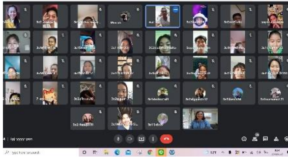
ภาพที่ 4 การใช้แอปพลิเคชัน Google meet สอนแบบมุขปาฐะออนไลน์

การปฏิบัติดนตรีไทย ตามแนวคิดสู่การศึกษาในยุคศตวรรษที่ 21 มีความคิดสร้างสรรค์ เป็นต้นกล้าวัฒนธรรมที่ขับเคลื่อนวงการศึกษาดนตรีไทยสืบไป