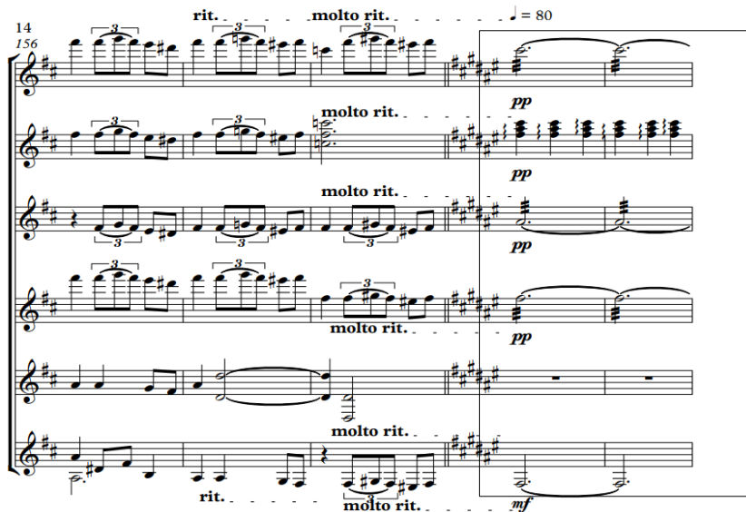
ภาพที่ 10 ตัวอย่างการเลือกใช้เทคนิคการกวาดสาย และการเล่นร็วโน้ต ห้องที่ 159 - 160

เพื่อเพิ่มสีสันของเสียงกีตาร์ ซึ่งจะใช้เทคนิคนี้ควบคู่กับการปฏิบัติโน้ตทำนองหลัก เพื่อเพิ่มความชัดเจนของโน้ตที่มีค่าน้อยยาว