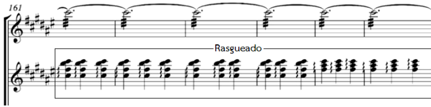
ภาพที่ 9 ตัวอย่างการเลือกใช้เทคนิคการกวาดสาย ห้องที่ 161 – 166