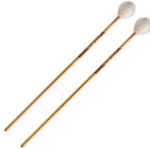
ภาพที่ 3 ไม้มาริมบา (Marimba Mallets)

ประเภท Innovative Percussion Marimba Mallets – Soft Medium Hard – Jim Casella Series