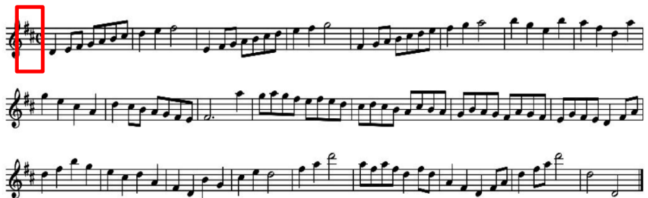
ภาพที่ 6 Twenty - one Exercises on Detached Note, in Different Keys (Key of D no.13)