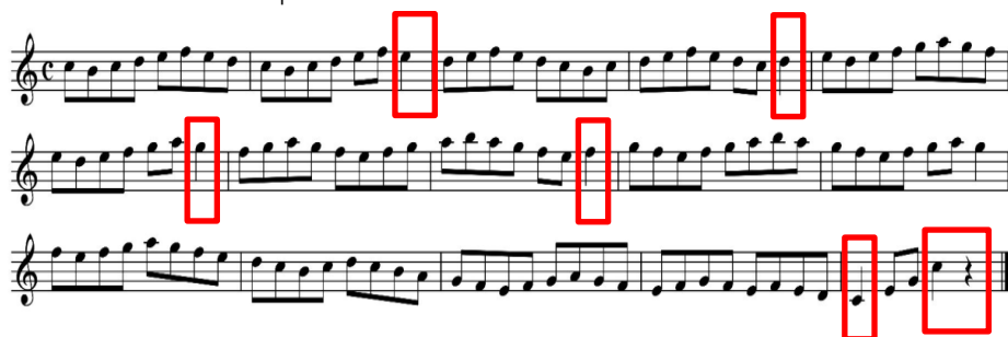
ภาพที่ 3 Twenty Progressive Exercises (no.3)

จากแบบฝึกหัดทั้ง 2 ข้อเห็นได้ว่าเป็นแบบฝึกหัดสั้น ๆ เพื่อให้ผู้ฝึกสามารถบรรเลงได้อย่างต่อเนื่องไม่หยุดเลย ทั้งยังเป็นอัตราจังหวะและค่าโน้ตที่ง่ายต่อการอ่าน ถ้ามีโน้ตความถี่เยอะเช่นโน้ตเซปต์ 2 ชั้น จะทำให้การอ่านโน้ตและการรับรู้ข้อมูลนั้นช้าลงทำให้ผู้ฝึกไม่สามารถบรรเลงได้ทันที ซึ่งผู้ฝึกควรให้ความสำคัญในการเลือกโน้ตที่จะมาฝึกทักษะนี้เช่นกัน และสิ่งที่ต้องคำนึงถึงอีกเรื่องหนึ่งคือโน้ตที่ฝึกควรมีหลายค่าโน้ตเช่นกัน เพื่อให้ผู้ฝึกนั้นได้ฝึกฝนในรูปแบบจังหวะที่หลากหลายมากขึ้นไปพร้อม ๆ กัน