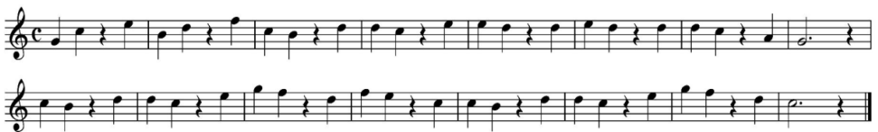
ภาพที่ 2 Progressive Exercises on Time (Exercises on Resets no.82)

โดยเริ่มแรกผู้ฝึกอาจจะเริ่มที่ภาพที่ใช้รูปแบบจังหวะแบบซ้ำ ๆ เดิม ๆ อย่างเช่นภาพที่ 1 แบบฝึกหัดจะให้รูปแบบจังหวะเหมือนกันทุกห้อง โดยมีตัวหยุดที่จังหวะที่ 1 และตัวดำที่จังหวะที่ 2-4 จะเป็นโน้ตตัวดำ ซึ่งเป็นการไล่เสียงลงและขึ้น ในส่วนนี้จะช่วยให้ผู้ฝึกนั้นรู้สึกเคยชินกับจังหวะและระดับเสียงที่ง่ายต่อการอ่านโน้ต ทั้งนี้การเริ่มควรเริ่มฝึกที่บันไดเสียงง่าย การเลือกแบบฝึกหัด ในการฝึกซ้อมสามารถเลือกได้จากแบบฝึกหัดเล่มเดียวกันได้เพราะมีเนื้อหาที่แบ่งเป็นสัดส่วนความยากง่ายของแต่ละเล่มอยู่แล้ว ผู้ฝึกสามารถเลือกได้ตามความสามารถของตนเองหรือแบบฝึกหัดที่มีความยากอยู่ต่ำกว่าระดับความสามารถของตนเองได้ (ณัฐ เชียงทอง, 2555 : 35 อ้างอิงจาก Richard Provost, 1992)