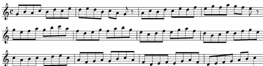
ภาพที่ 4 Twenty Progressive Exercises (no.4)