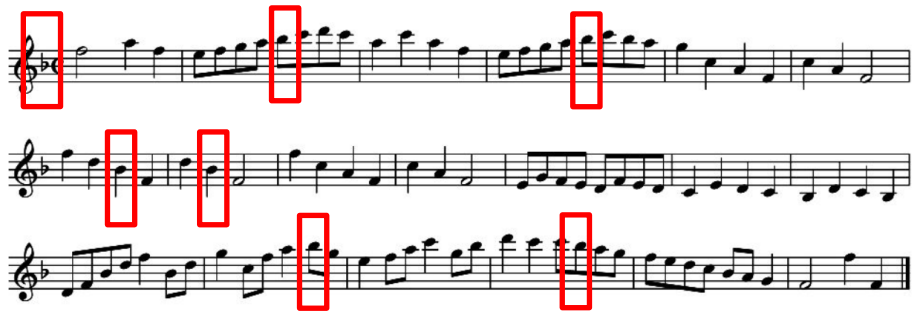
ภาพที่ 5 Twenty - one Exercises on Detached Note, in Different Keys (Key of F no.3)

ในภาพที่ 3 และ 4 นี้จะเป็นการเพิ่มความถี่ของโน้ตเพ็ชขึ้นคือค่าโน้ตเซบิต 1 ชั้น แต่จะเห็นได้ว่าระดับเสียงในแบบฝึกหัดนี้ยังอยู่บนช่วงเสียงที่ง่ายต่อการบรรเลงแซกโซโฟน คืออยู่ในรูปแบบการไลโน้ต และอยู่บนบันไดเสียงที่ง่ายต่อการบรรเลงแต่ก็มีการใช้โน้ตตัวดำผสมอยู่ในแบบฝึกหัด และเป็นแบบฝึกหัดที่เริ่มมีจำนวนห้องเพิ่มขึ้น ทำให้ผู้อ่านที่เริ่มฝึกอ่านนั้นต้องมีสมาธิในการฝึกมากขึ้น ในการฝึกนั้นควรตั้งจังหวะที่มีความเร็วอยู่ในระดับปานกลางที่ผู้ฝึกนั้นสามารถควบคุมระบบนิ้วของตนเองได้ เนื่องจากโน้ตมีความถี่ที่มากขึ้น รวมไปถึงการก้าวกระโดดของโน้ตที่มีความยากมากยิ่งขึ้น