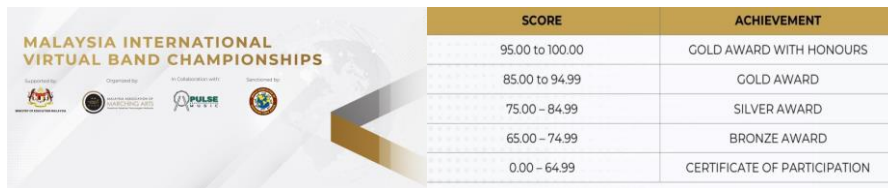
ภาพที่ 9 ผลสัมฤทธิ์จากการประกวดในรายการ MIVBC (ที่มา : Malaysia Marching Arts, 2021: Online)

4.2 เป้าหมายของการศึกษาต่อในระดับอุดมศึกษา หรือศึกษาต่อด้านดนตรี ในหน่วยงานอื่น ๆ ซึ่งนักเรียนในวงดุริยางค์เครื่องลมในระดับชั้นมัธยมศึกษาปีที่ 3 และ 6 ได้มีเป้าหมายของการฝึกซ้อมเพื่อศึกษาต่อด้านดนตรี ทั้งระดับอุดมศึกษา และดุริยางค์ 4 เหล่าทัพ จึงมีเป้าหมายที่ต้องการฝึกซ้อมให้ผ่านการประเมินทักษะ ของสถาบันอุดมศึกษา โดยมีการบันทึกภาพและเสียงการบรรเลงของตนเอง เพื่อให้ ผู้สอนทำการประเมินในเบื้องต้น และมีการแนะนำแนวทางจากผู้เชี่ยวชาญในกลุ่ม เครื่องดนตรีของตนเอง แล้วจึงจะส่งภาพและเสียงที่ดีที่สุดในการส่งเข้าสอบศึกษาต่อ ได้อย่างมีประสิทธิภาพ