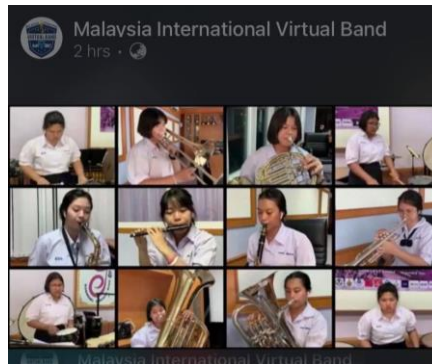
ภาพที่ 1 การประกวด MIVBC ของนักเรียนโรงเรียนสุนารีวิทยา

การประกวดในระดับนานาชาติ ซึ่งถือว่าเป็นการกำหนดเป้าหมายที่สร้างแรงจูงใจในการฝึกซ้อมให้กับนักเรียนได้เป็นอย่างดี รวมถึงเป็นสร้างโอกาสในการพัฒนาตนเอง การได้รับรางวัลสร้างชื่อเสียงให้กับประเทศชาติในภาวะวิกฤตที่จะสามารถเปลี่ยนแปลงให้เป็นโอกาสที่ดีให้กับนักเรียนได้ รวมถึงการอบรมสัมมนาเชิงปฏิบัติการผ่านระบบออนไลน์ที่ในปัจจุบันได้รับความนิยมเป็นอย่างมากทำให้ได้รับความรู้ด้านดนตรีจากนักดนตรีมืออาชีพระดับโลกได้ง่ายเพียงการเผยแพร่ความรู้ผ่านอินเทอร์เน็ต ทำให้สามารถเข้าถึงข้อมูลข่าวสารได้ง่าย โดยการประกวดที่นักเรียนได้มีโอกาสเข้าร่วมในช่วงโควิด-19 เช่น Malaysia International Virtual Band Championships CGN Competition และ Thailand World Music Championships 2020 เป็นต้น