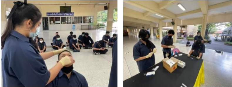
ภาพที่ 5 มาตรการตรวจคัดกรองก่อนฝึกซ้อมโรงเรียนราชวินิตแก้ว (ที่มา : ไกรสร จุฬาทิพย์, 2564)

ในด้านการบริหารจัดการอุปกรณ์ดนตรีควรคำนึงถึงมาตรการและการจัดระบบของการยืม-คืนเครื่องดนตรีในกรณีที่นักเรียนต้องนำกลับไปซ้อมที่บ้าน และเมื่อนักเรียนสามารถเข้ามาฝึกซ้อมที่โรงเรียนได้ ผู้สอนควรต้องมีการวางแผนระบบการจัดการที่ดี เพื่อคำนึงถึงความปลอดภัยของนักเรียนเป็นหลัก