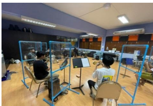
ภาพที่ 4 สร้างฉากกั้นน้ำลายระหว่างการฝึกซ้อมโรงเรียนราชวินิตบางแก้ว

ในกรณีสถานการณ์ของการแพร่ระบาดในระดับ 3 ที่เริ่มมีการรวมวงขนาดเล็กได้ ผู้สอนจะต้องหามาตรการป้องกันที่ทำให้เกิดความปลอดภัยต่อนักเรียนมากที่สุด เช่น การสร้างฉากกั้นน้ำลายของเครื่องลม การจัดเก้าอี้เพื่อรักษาระยะห่างขณะนั่งฝึกซ้อม รวมถึงการทำความสะอาดด้วยแอลกอฮอล์อย่างสม่ำเสมอ เพื่อให้เกิดความมั่นใจต่อการหยุดยั้งการแพร่ระบาดของโควิด-19 ได้