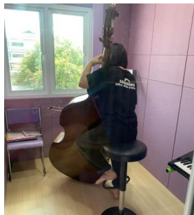
ภาพที่ 3 จัดระบบของห้องซ้อมเดี่ยว โรงเรียนสุนารวีวิทยา (ที่มา : อภิวุฒิ มินาลัย, 2564)

ในกรณีสถานการณ์ของการแพร่ระบาดในระดับ 3 ที่เริ่มมีการรวมวงขนาดเล็กได้ ผู้สอนจะต้องหามาตรการป้องกันที่ทำให้เกิดความปลอดภัยต่อนักเรียนมากที่สุด เช่น การสร้างฉากกั้นน้ำลายของเครื่องลม การจัดเก้าอี้เพื่อรักษาระยะห่างขณะนั่งฝึกซ้อม รวมถึงการทำความสะอาดด้วยแอลกอฮอล์อย่างสม่ำเสมอ เพื่อให้เกิดความมั่นใจต่อการหยุดยั้งการแพร่ระบาดของโควิด-19 ได้