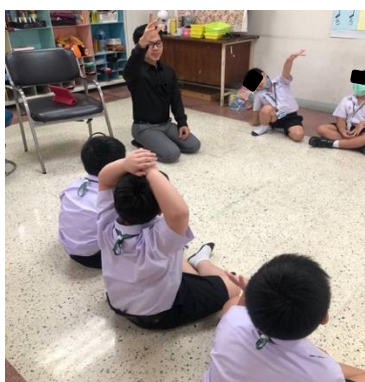
ภาพที่ 1 กิจกรรมโยกย้ายตามทำนอง

2. บทเพลงที่ใช้สำหรับกิจกรรมโยกย้ายตามทำนอง ควรเลือกใช้เพลงบรรเลงที่มีจังหวะปานกลาง มีเสียงดนตรีที่ไพเราะ เช่น เพลง Cross Dance, เพลง Twinkle twinkle little star, เพลง Clap clap song เป็นต้น ครูควรศึกษาความชื่นชอบและไม่ชอบในส่วนของบทเพลงที่ใช้ทำกิจกรรม หากเลือกเพลงที่เด็กก้อทิสติกไม่ชอบอาจส่งผลให้เด็กก้อทิสติกไม่ให้ความร่วมมือในการทำกิจกรรม หรือเกิดพฤติกรรมไม่พึงประสงค์ได้ เช่น ร้องไห้ โวยวาย หรือส่งเสียงดัง เป็นต้น