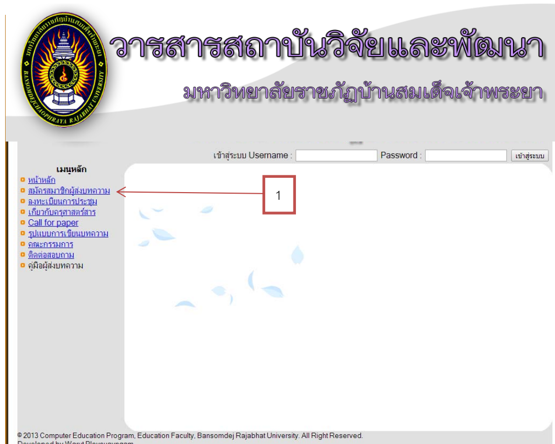
ภาพที่ ค-1 หน้าแรก

1. ผู้สนใจส่งบทความความสามารถคลิกที่ลิงค์ สมัครสมาชิกผู้ส่งบทความ ตามหมายเลข 1 ได้ดังรูป