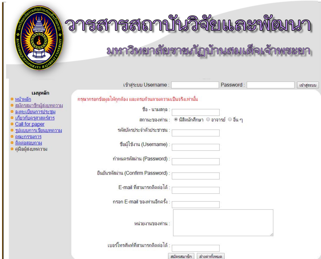
ภาพที่ ค-2 หน้าสมัครสมาชิก

2. หน้าสมัครสมาชิก ให้ผู้สมัครกรอกข้อความให้ครบจากนั้นคลิก ปุ่มสมัครสมาชิก