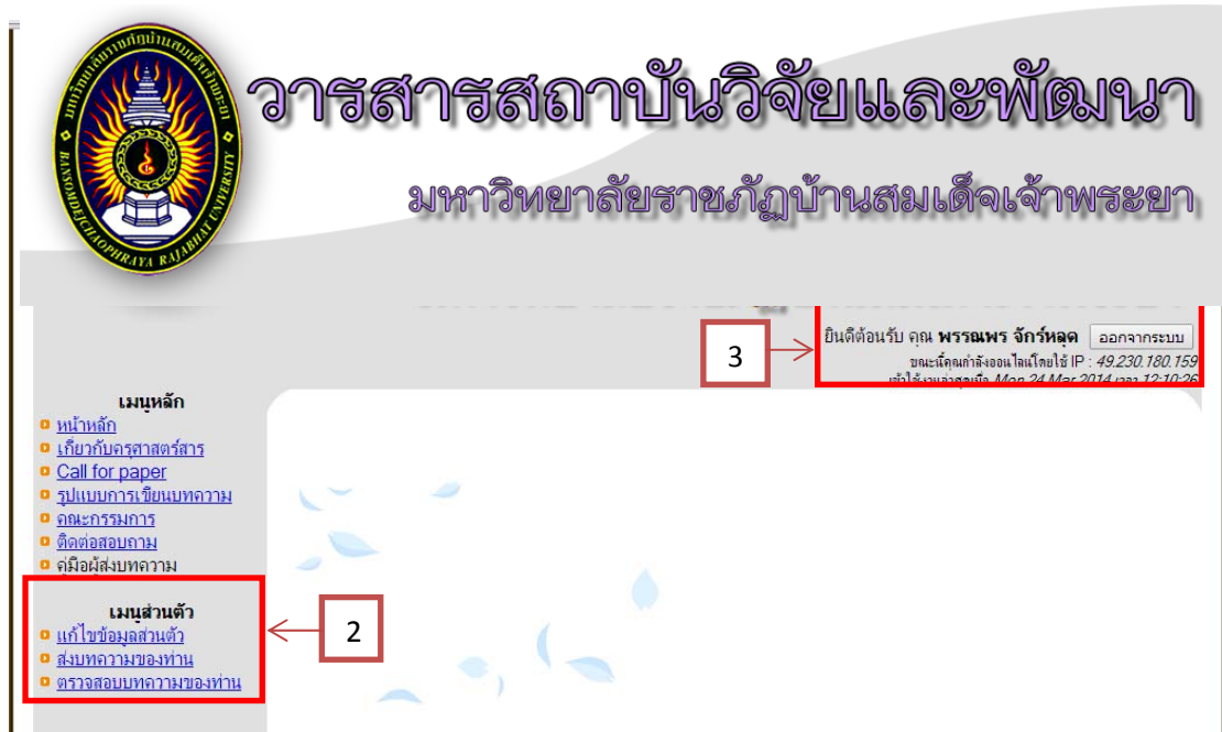
ภาพที่ ค-4 หน้าเข้าสู่ระบบ

4. เมื่อ Login มาแล้วจะมีเมนูผู้ใช้งานอยู่ใต้กลุ่มเมนูหลักตามหมายเลข 2 และขึ้นชื่อผู้ใช้งานตามหมายเลข 3